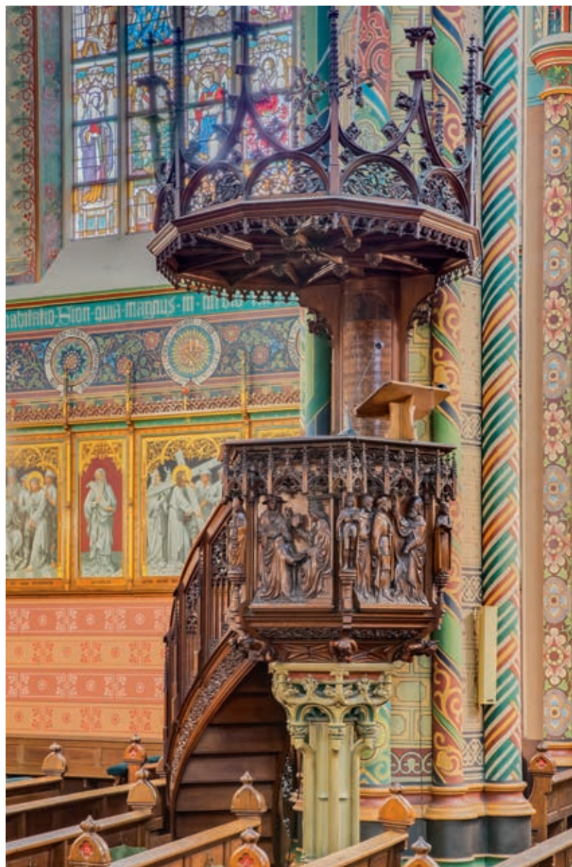
De preekstoel van Mengelberg uit 1885, waarop twee afbeeldingen uit het leven van Sint-Willibrordus te zien zijn. Paus Sergius wijdt Willibrordus tot aartsbisschop der Friezen en geeft hem relieken mee, en de heilige probeert de Friese koning Radboud te bekeren.

Tegen de zuidwestelijke vieringpijler staat de preekstoel. Deze is in 1885 door F.W. Mengelberg en zijn atelier vervaardigd. Zowel het houtsnijwerk als het beeldhouwwerk in steen zijn opvallend rijk uitgewerkt. De circa 5 meter hoge preekstoel heeft een vijfdelige opbouw. De constructie is onderaan voorzien van een zeshoekige stenen 104 voet ter ondersteuning van een stenen beeldhouwde schacht. De decoratie hiervan bestaat uit